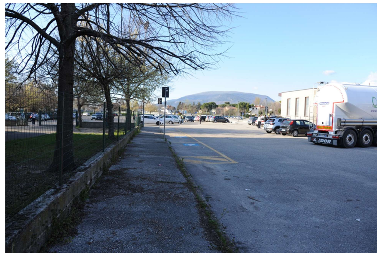
P.12 – Foto da Largo Giovanni Falcone Paolo Borsellino verso le attuali aree sosta per disabili e il parcheggio del Plateatico