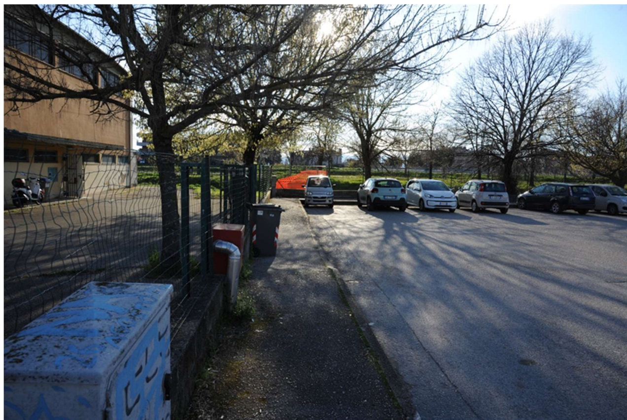
P.13 – Foto da Largo Giovanni Falcone Paolo Borsellino verso il Canale dei Molini , sulla sinistra la palestra Porta Todi