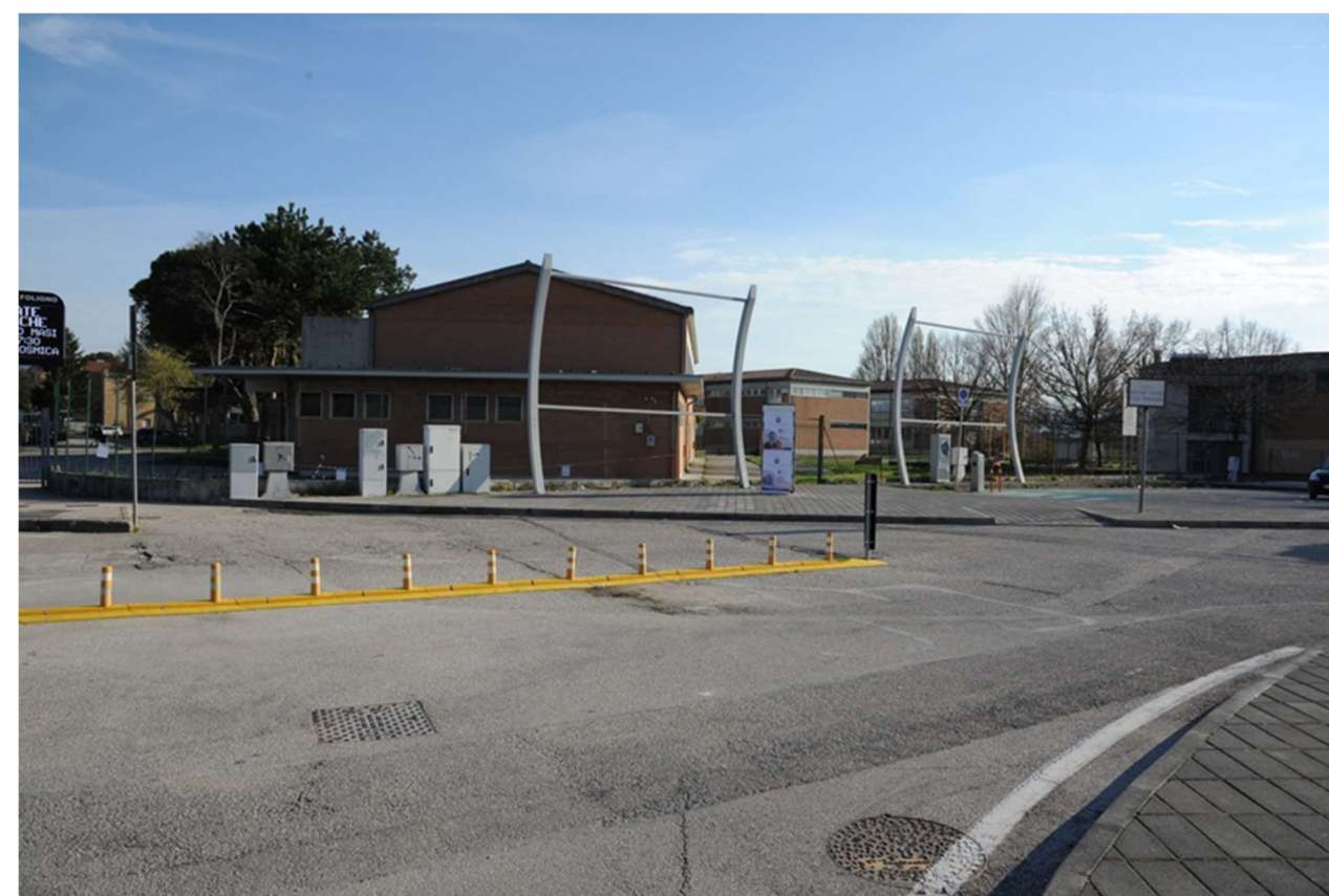
P.8 – Foto dal marciapiede antistante alla palazzina servizi verso Largo Giovanni Falcone Paolo Borsellino e il Polo scolastico