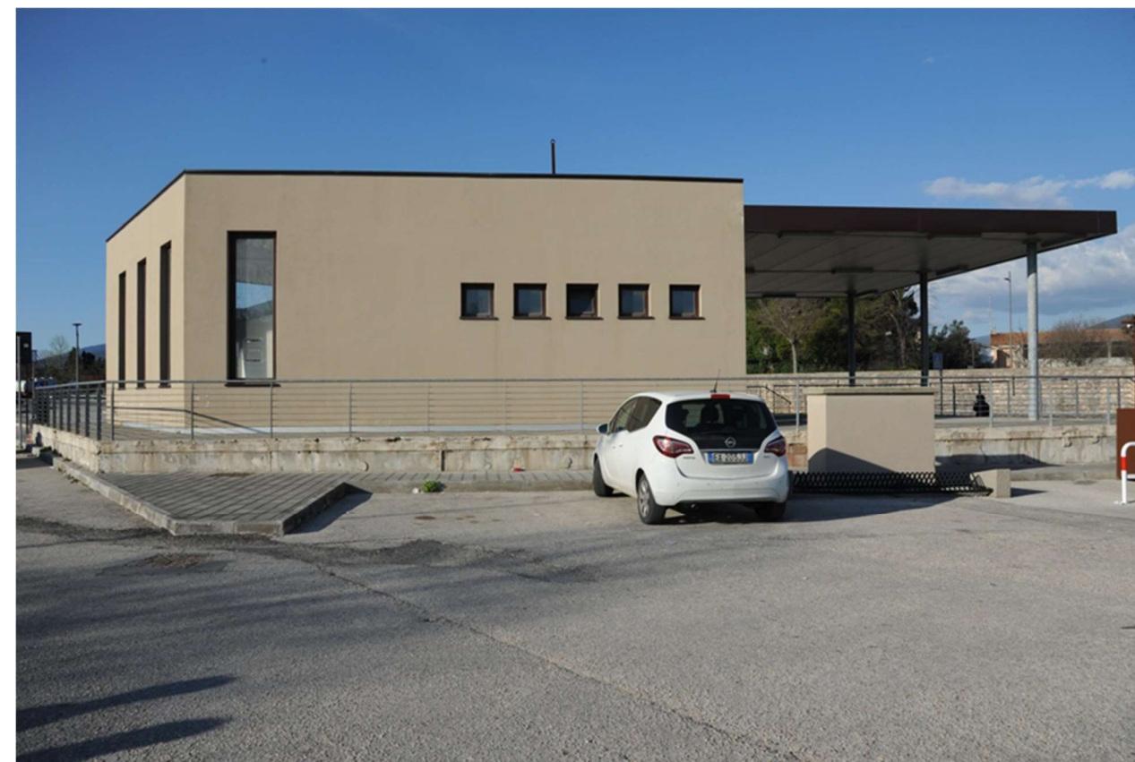
P.6 – Foto dal parcheggio del Plateatico : vista del prospetto sud della palazzina servizi