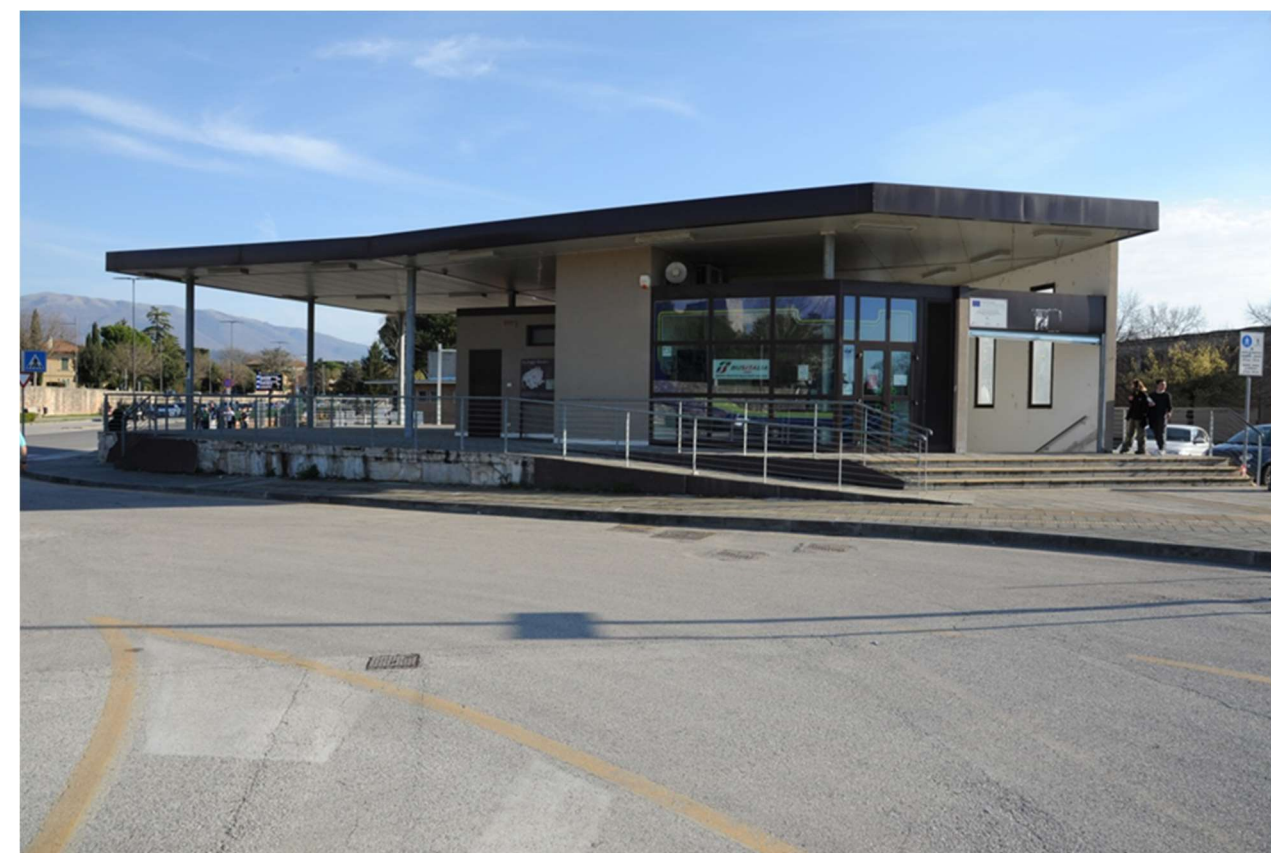
P.4 – Foto dall'area sosta autobus: vista del prospetto nord della palazzina servizi