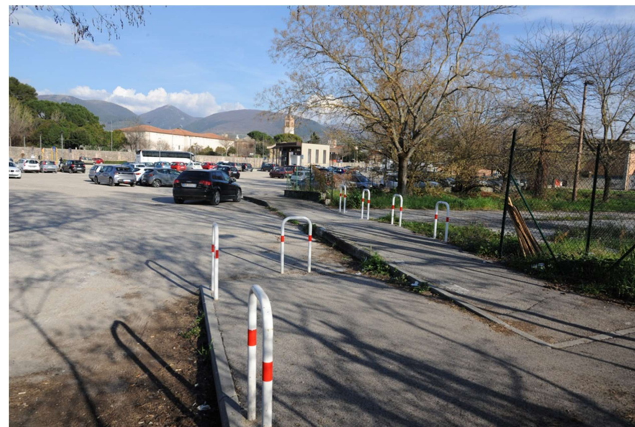
P.16 – Foto dalla recinzione di delimitazione ovest con vista sulla congiunzione con il percorso ciclabile esistente che costeggia il fiume Topino