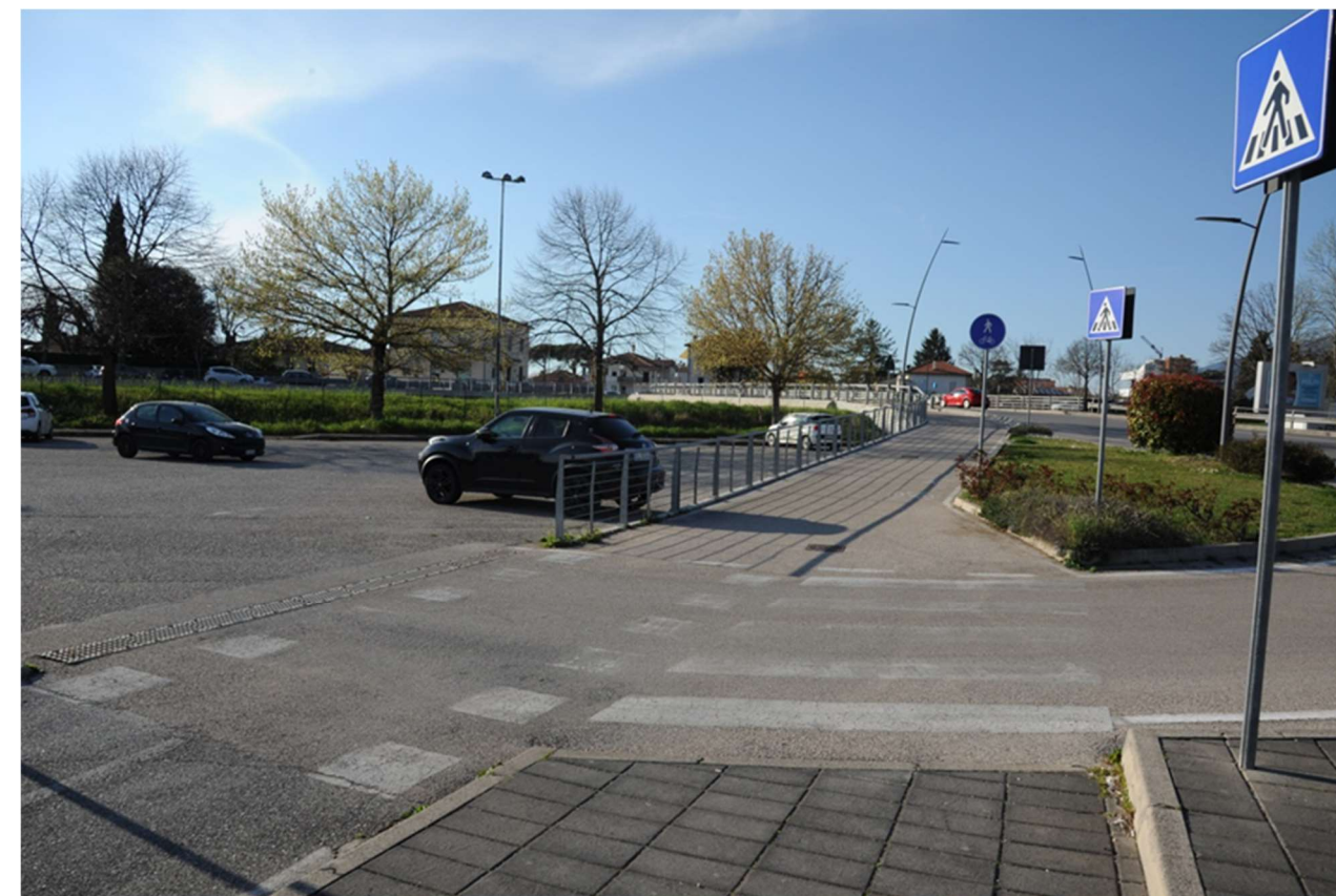
P.2 – Foto dal percorso ciclopedonale di via Fratelli Bandiera , a nord-ovest dell'area di intervento in direzione del Ponte Nuovo: sulla sinistra il parcheggio del Plateatico