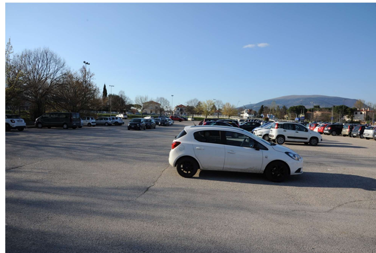
P.14 – Foto dall'interno del parcheggio del Plateatico in direzione di Ponte Nuovo