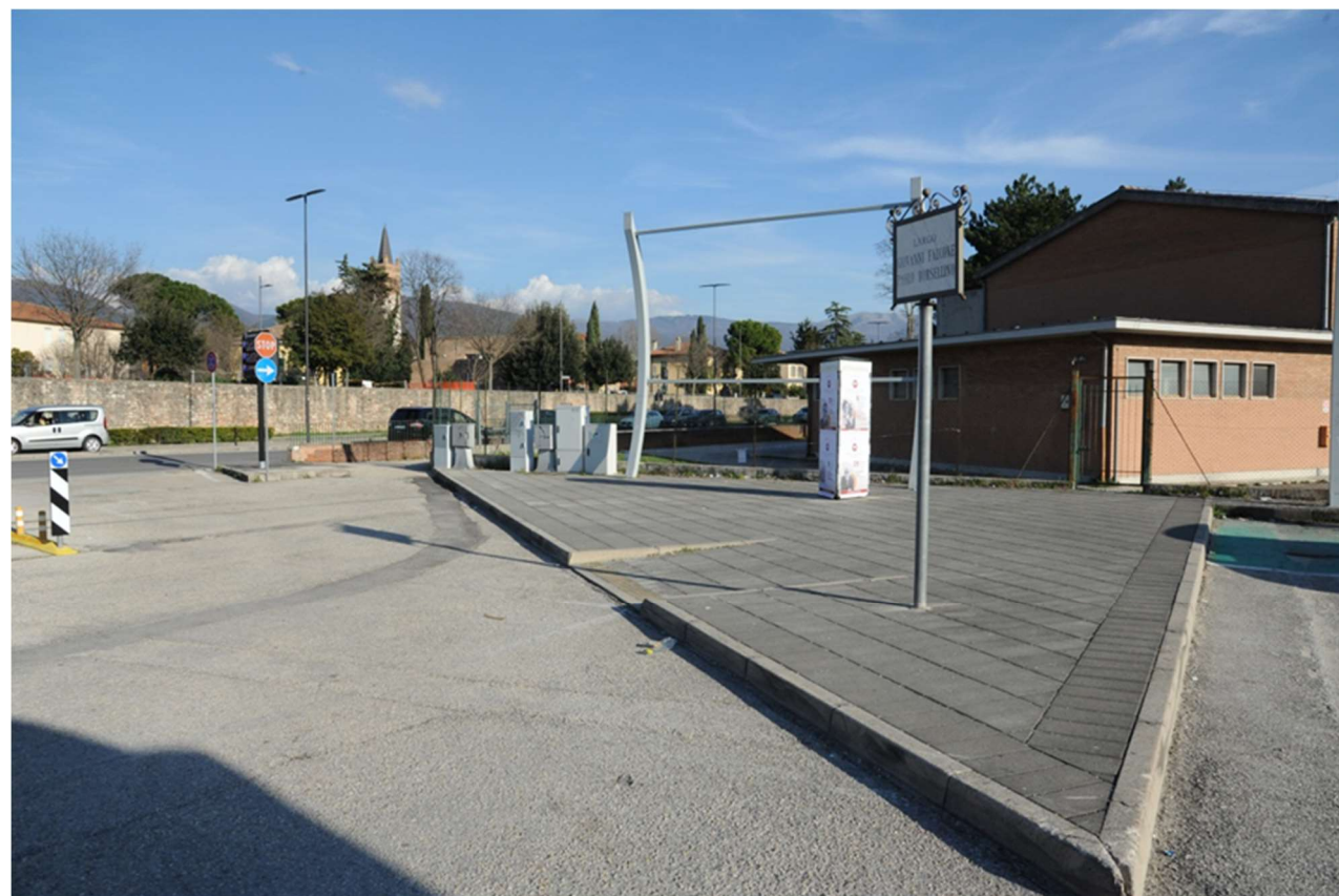
P.9 – Foto da Largo Giovanni Falcone Paolo Borsellino verso via Fratelli Bandiera