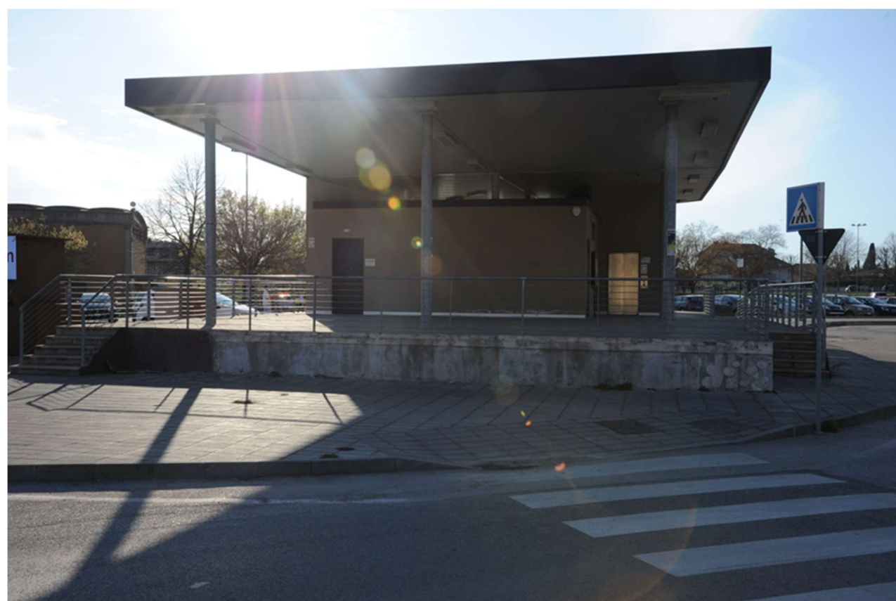
P.7 – Foto da via Fratelli Bandiera : vista del prospetto est della palazzina servizi