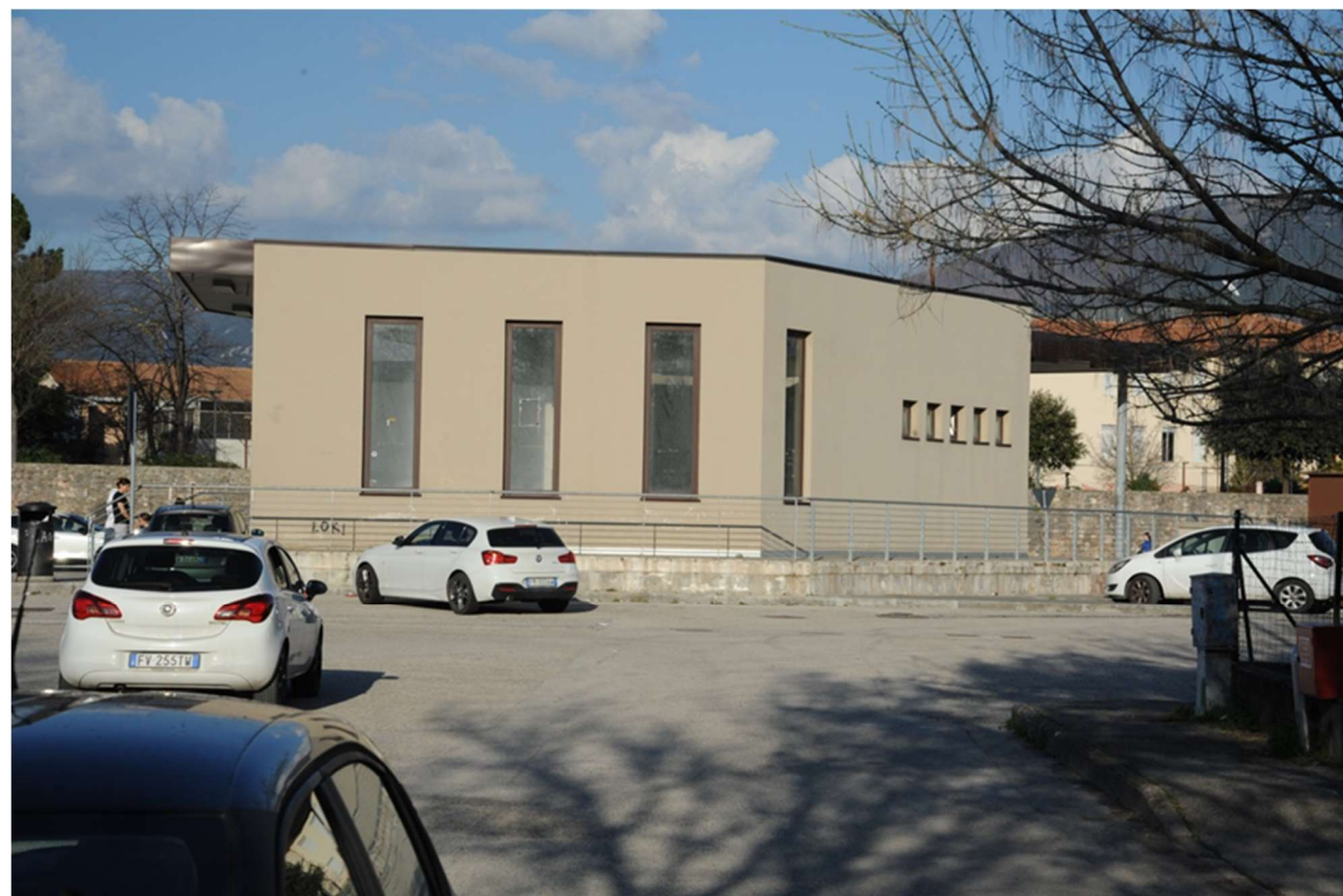
P.5 – Foto dal parcheggio del Plateatico : vista del prospetto ovest della palazzina servizi