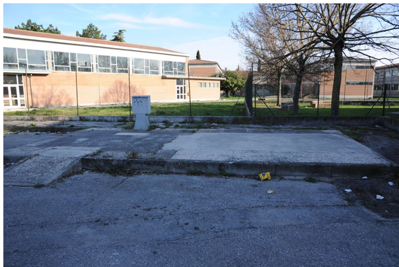
P.11 – Foto da Largo Giovanni Falcone Paolo Borsellino verso il Polo scolastico