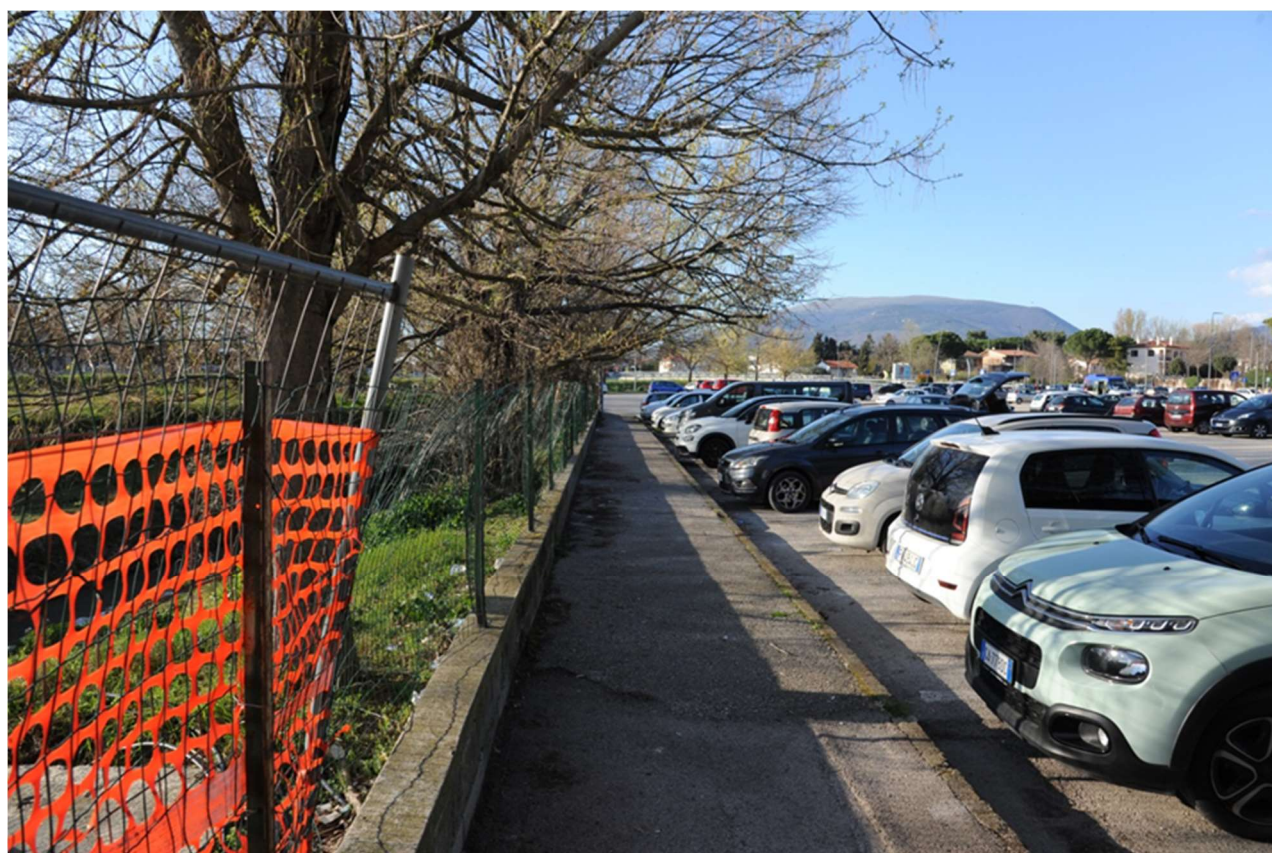
P.15 – Foto nei pressi della recinzione di delimitazione con il Canale dei Molini