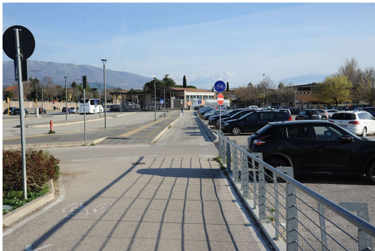
P.1 – Foto dal percorso ciclopedonale di via Fratelli Bandiera , a nord-ovest dell'area di intervento: sulla sinistra le corsie dedicate alla sosta autobus e sulla destra il parcheggio del Plateatico