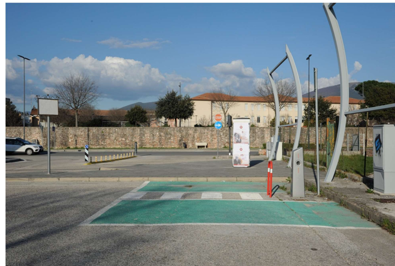
P.10 – Foto da Largo Giovanni Falcone Paolo Borsellino nei pressi delle aree di ricarica auto elettriche verso le mura storiche di via Fratelli Bandiera